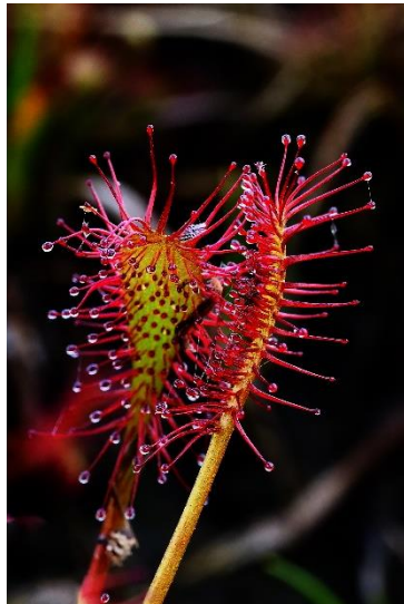
Zonnedauw 1 -Henk Schell.