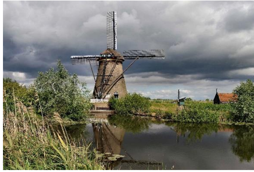
Daar bij die molen. – Yvonne den Harder.