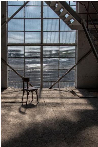
In het zonnetje. -Hans Moerenhout.