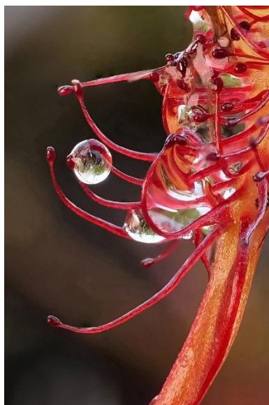
Zonnedauw 2 – Henk Schell.